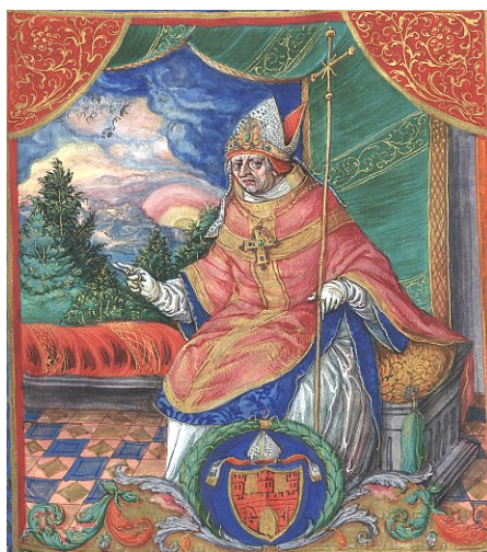
Ryc. 3. Abp Janusz Suchywilk h. Grzymała, Gospodarz Uniejowa w latach 1374–1382 (wg J. Długosz, Catalogus archiepiscoporum Gnesnensium , Kraków 1531–1535)

Domarat, starosta wielkopolski z rodu Grzymalitów, pochodził z rodziny posiadającej już w czasach Kazimierza Wielkiego silną pozycję oraz wpływy. W karierze wiele zawdzięczał arcybiskupowi Janowi Suchywilkowi 31 , którego był bratankiem (ryc. 3). W roku 1373 brał udział w poselstwie do Awinionu 32 . Na starostwo generalne wielkopolskie mianowany został przez królową Elżbietę w roku 1377 33 i pełnił tę funkcję do, co najmniej, października 1382 r. Domarat, jako starosta generalny wielkopolski, nie cieszył się popularnością w dzielnicy, w której przeważa-