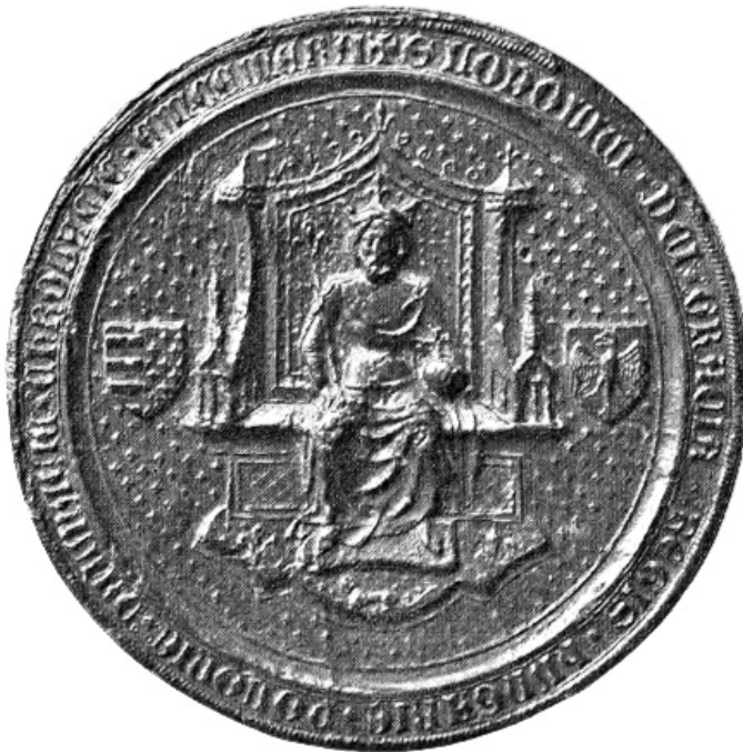
Ryc. 1. Pieczęć Ludwika Węgierskiego z 1370 r.