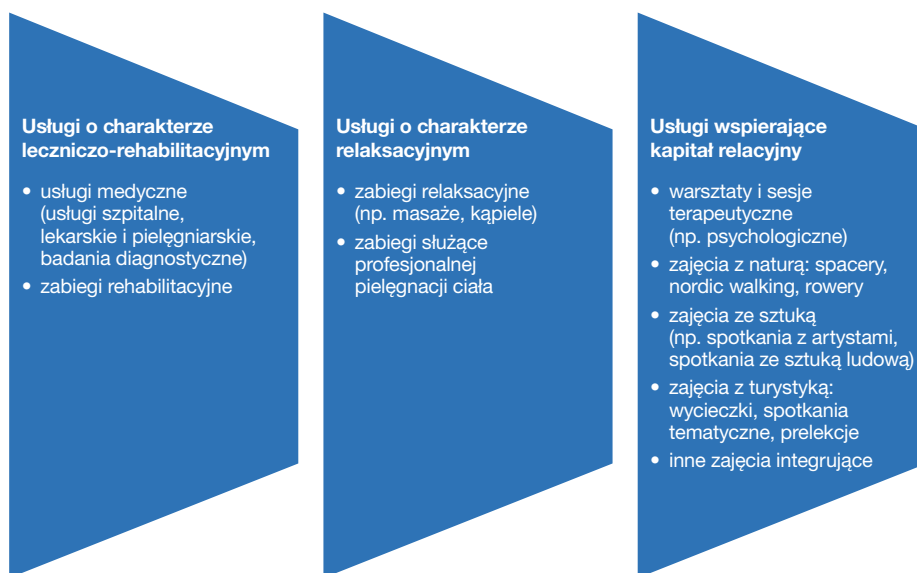
Ryc. 3. Paleta potencjalnych usług oferowanych przez ośrodki Pasma uzdrowiskowo-wypoczynkowego Uniejów–Poddębice–Rogóżno

układów uzdrowiskowo-wypoczynkowych 13 posiadających największy potencjał rozwojowy, które mają odgrywać decydującą rolę w budowaniu zróżnicowanej i komplementarnej oferty leczniczej, profilaktycznej i turystyczno-wypoczynkowej. Ze względu na istniejące zasoby, doświadczenie oraz dotychczasową dynamikę zmian szczególną rolę przypisano Pasmu Uniejów–Poddębice–Rogóżno. Posiada ono bowiem predyspozycje do „zbudowania” kompleksowej oferty adresowanej do rodzin z dziećmi, osób dorosłych aktywnych zawodowo i fizycznie oraz osób starszych w oparciu o różnorodne usługi oferowane przez trzy ośrodki, tj. Uniejów jako dominujący ośrodek o charakterze uzdrowiskowo-turystycznym, Poddębice o charakterze turystyczno-leczniczym oraz Rogóżno o charakterze leczniczo-uzdrowiskowym 14 . Kluczowe zatem jest zaprojektowanie komplementarnej oferty leczniczej oraz poza leczniczej, koncentrującej się między innymi na profilaktyce, wypoczynku oraz regeneracji (ryc. 3).