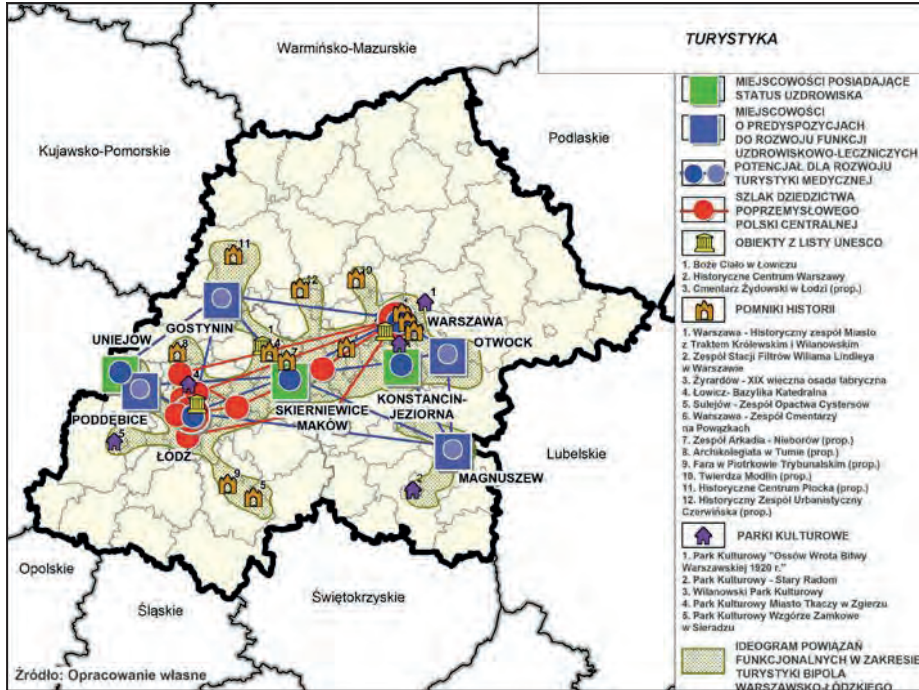
Ryc. 2. Koncepcja powiązań funkcjonalnych w obszarze turystyka

i aktualizowanych strategii rządowych i wojewódzkich, jak również punkt odniesienia dla lokalnych strategii rozwoju oraz strategii rozwoju obszarów funkcjonalnych, obejmujących w szczególności obszary metropolitalne Warszawy i Łodzi 7 .