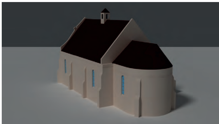
Ryc. 4. Rekonstrukcja siedemnastowiecznego wyglądu kościoła parafialnego pw. św. św. Piotra i Pawła, Grodzisko

Zaznaczyć przy tym trzeba, że współczesne formy tytułowego obiektu są wynikiem kilku renowacji oraz kilkakrotnej rozbudowy i trudno dziś jednoznacznie odtworzyć jego pierwotny wygląd. Partiami siedemnastowiecznymi kościoła są korpus, prezbiterium oraz zakrystia wzniesione i najprawdopodobniej otynkowane przed 1636 rokiem, na co wskazują informacje zawarte w przeprowadzonej w tymże roku wizytacji 13 (ryc. 4, 5).