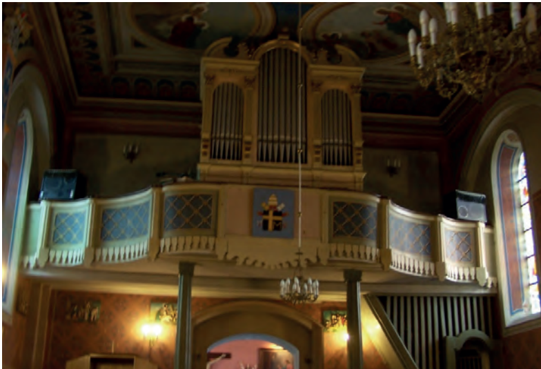
Ryc. 3. Chór, kościół parafialny pw. św. św. Piotra i Pawła, Grodzisko (fot. K. Jarno-Cichosz, 2014)

We wnętrzu świątyni, w partii korpusu, płaszczyzny ścian zostały podzielone parami pilastrów umieszczonych analogicznie do usytuowanych na zewnątrz szkarp. Wieńczą je kompozytowe kapitele, na których wsparto zwielokrotniony gzyms obiegający całą nawę, ozdobiony ponad kapitelami pilastrów skromnymi kartuszami herbowymi: Paparona i Rola (na ścianie północnej), Lis i Grzymała (na ścianie południowej). Pomiedzy pilastrami umieszczono w ścianach płytkie wnęki, którym nadano formy łuków arkad. Korpus i prezbiterium przykryte zostały sklepieniami zwierciadlanymi; w zakrystii zdecydowano się na sklepienie kolebkowe. W części zachodniej korpusu znajduje się chór muzyczny o konstrukcji drewnianej wraz z organami pochodzącymi z lat 20. XX wieku 11 (ryc. 3).