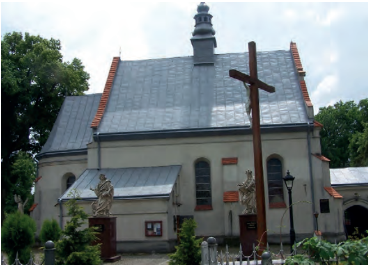
Ryc. 6. Obecny wygląd kościoła parafialnego pw. św. św. Piotra i Pawła w Grodzisku

Dzięki trosce administratorów parafii Grodzisko tamtejsza świątynia, choć często wymagająca napraw i modernizacji, przetrwała minione wieki w dobrym stanie (ryc. 6), co stanowi pokłosie intensywnych prac przeprowadzanych w drugiej połowie XIX wieku, pomimo iż kolejne wizytacje odnotowywały konieczność wykonania większych prac remontowych o różnej skali. W tym czasie – zapewne wychodząc naprzeciw potrzebom wiernych – zwiększono dotychczasową kubaturę kościoła poprzez dobudowę kruchty zachodniej, w której dziś umieszczone są ławki dla wiernych.