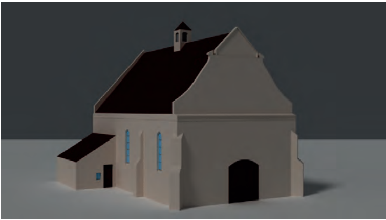
Ryc. 5. Rekonstrukcja siedemnastowiecznego wyglądu kościoła parafialnego pw. św. św. Piotra i Pawła, Grodzisko

uwagę na ubytki w podłodze drewnianej wykonanej z tarcic, a także stary dach, miejscami popsuty. Ponadto wspomina zatartą malaturę ścian, potwierdzając tym samym, że kościół w Grodzisku był już wówczas otynkowany i pomalowany 16 . Dekadę później, podczas kolejnej wizytacji, odnotowano pogarszający się stan kościoła, jednocześnie zaznaczając, że rozpoczęto prace remontowe. Objęto nimi stary dach, „teraz poprawiany” 17 , lecz wizytator zwraca także uwagę na bardzo zły stan drewnianego chóru oraz części sufitu 18 . Wymienione prace miały najpewniej charakter zachowawczy i służyły doraźnemu zabezpieczeniu świątyni, o czym świadczy opis kościoła w parafii Grodzisko zamieszczony w wizytacji dziekańskiej z 1812 roku. Uwagę zwraca w nim, obok ponownej informacji o nie najlepszym stanie obiektu, informacja, że świątynia ta nie posiada żadnych kaplic 19 .