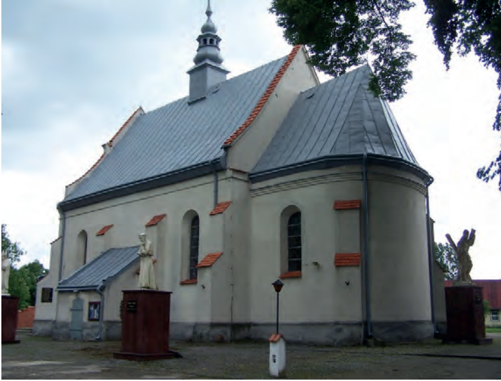
Ryc. 1. Kościół parafialny pw. św. św. Piotra i Pawła, Grodzisko